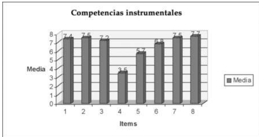
GRÁFICO 2: Evaluación del perfil competencial (competencias personales).