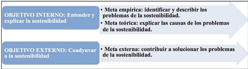
Figura 1: Objetivos esenciales de la universidad técnica respecto a la sostenibilidad

Los problemas de la sostenibilidad se expresan en forma multicausal, con efectos variados e interrelacionados, vinculados estrechamente con todas sus dimensiones, de tal forma que la docencia universitaria, basada en el enfoque problémico, encuentra un escenario ideal para la confrontación multidisciplinaria y transdisciplinaria en el modelo del profesional, al considerar las dimensiones de la sostenibilidad. Este desafío no se resuelve con la simple incorporación de una asignatura o disciplina en el plan de estudios de la carrera, ni aun con la creación de una nueva carrera universitaria. De lo que se trata es de incorporar una nueva visión en la formación del profesional universitario, basada en el paradigma de la sostenibilidad, y en correspondencia con ello determinar las nuevas formas de la enseñanza de las ingenierías para una actuación responsable hacia la naturaleza y la sociedad, con un enfoque innovador en el saber universitario, en la aprehensión del conocimiento y en su aplicación racional para encontrar soluciones apropiadas a los problemas identificados (Figura 2).